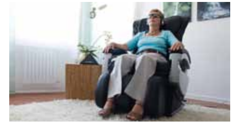
Entspannung pur im Massage-Sessel.

Knutschphobie gegen Mundgeruch – wer heute noch unter „Halitose“ leidet, verzichtet auf die schönste Nebensache der Welt!