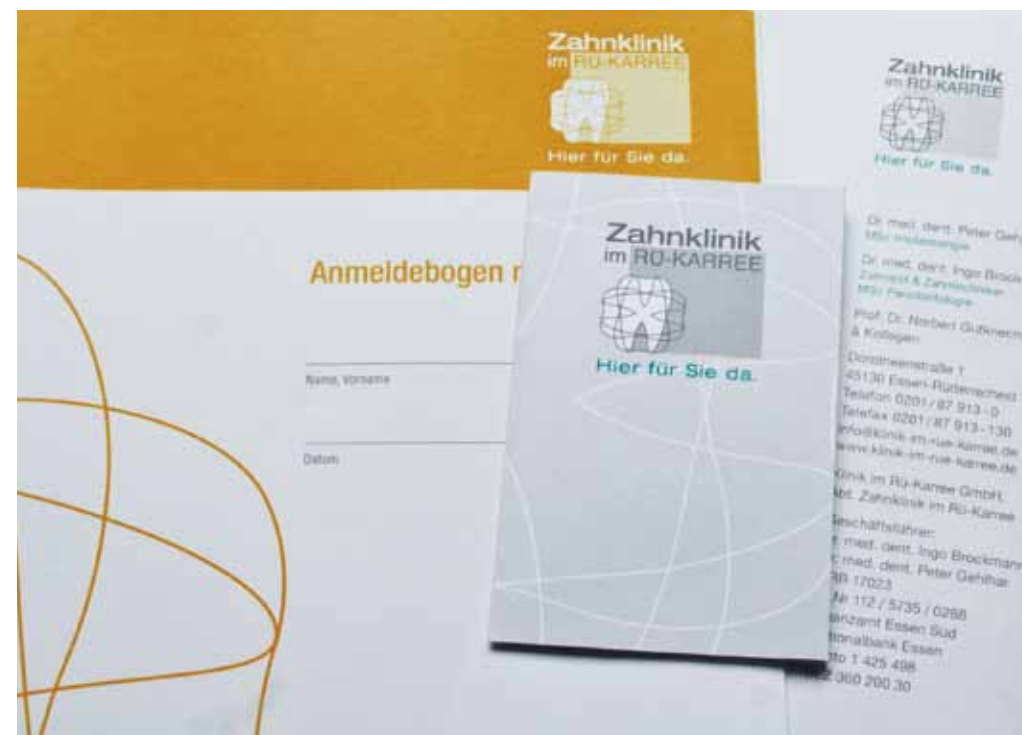
Lebensfreude und Kompetenz: Das neue Logo der Zahnklinik im Rü-Karree hält Einzug in die Klinik-Kommunikation.

Bei der Symbolisierung von Botschaften gerade im medizinischen Bereich kommt der Farbwahl im Artwork große Bedeutung zu. Deshalb fiel die Wahl auf eine Verbindung von beruhigend-sachlichem Grau mit einem edlen Dunkelgrün. Das Grün – eine mittlere und vermittelnde Farbe des Spektrums – steht für sicheren Halt und Kompetenz. Die gewählte Nuance wirkt beruhigend und anregend zugleich. So schaffen die Farben im Logo eine optische Verbindung zur ganzheitlichen und patientenorientierten Ausrichtung der Zahnklinik.