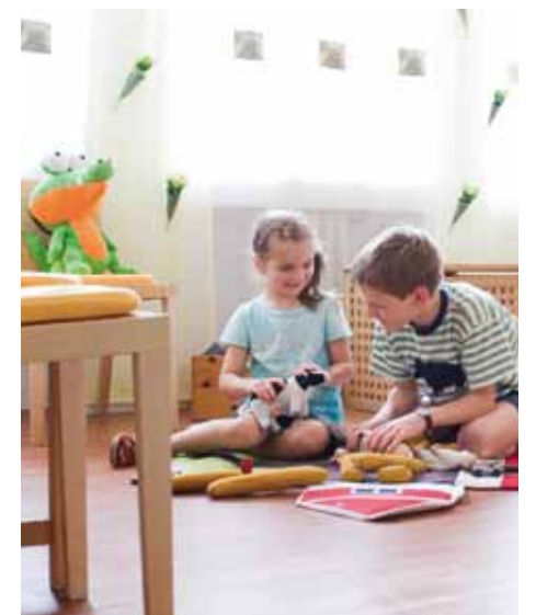
Die Spielecke in der „Benno Biber“-Kinderpraxis.